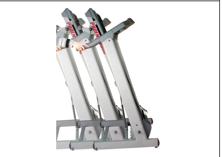
접이시 한손으로도 손쉽게 이동가능