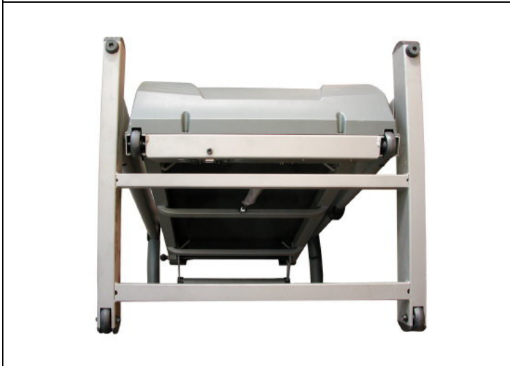
접이시 제품 밑면 (4개의 이동바퀴)