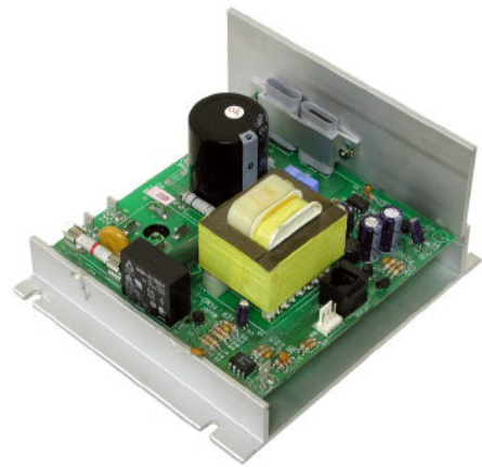
국내연구소에서 설계된 PCB