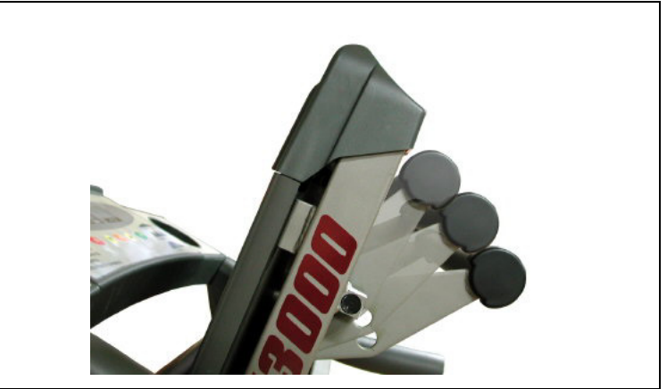
3단계 수동 경사 조절기능