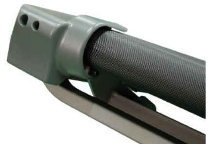
손가락 및 이물질 방지 보호용 End-Cap