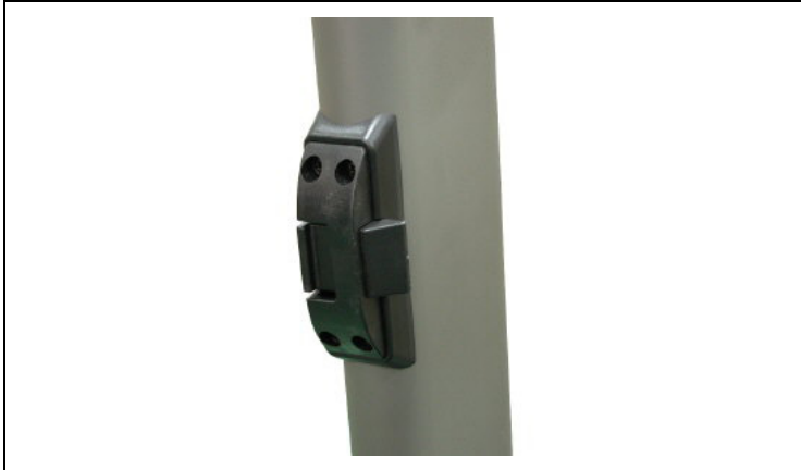
접이 잠금 장치 (왼쪽 핸들프레임에 위치)