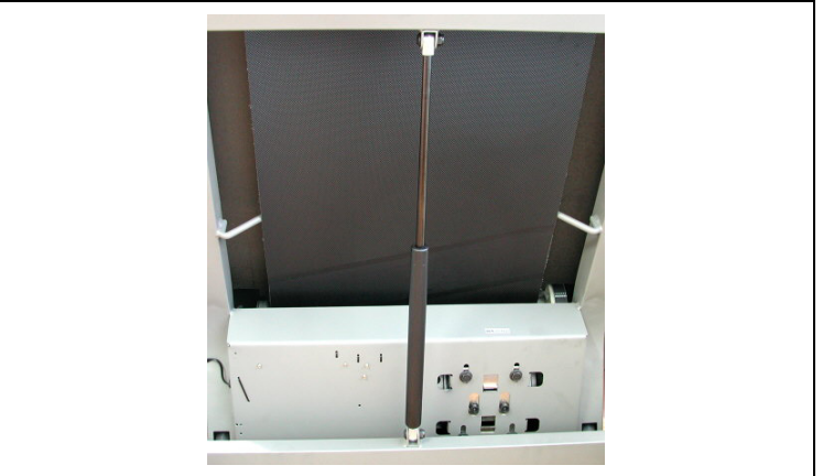
접이시 받판을 지탱해주는 유압실린더