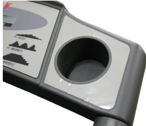
휴대폰 및 음료수 보관용 홀더 (별도 음료병 없음)