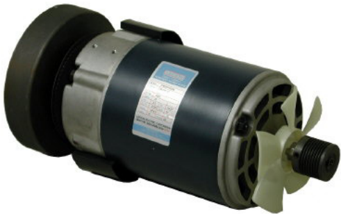
미국 Lesson사 최고 3HP DC 모터