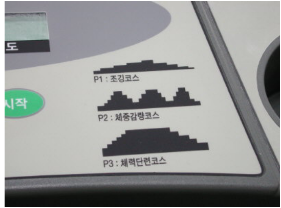
다이어트용 3가지 운동 프로그램