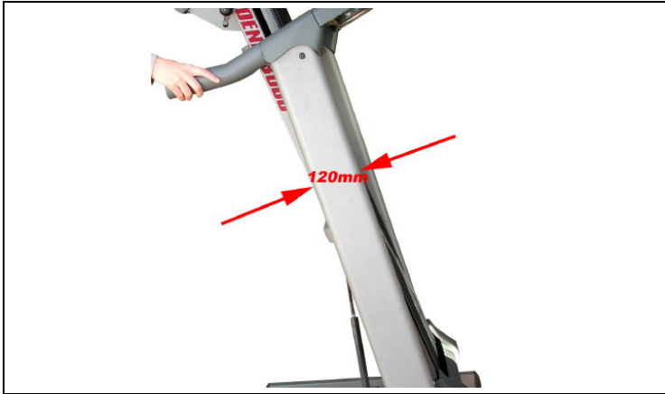
120mm 광폭 핸들 프레임