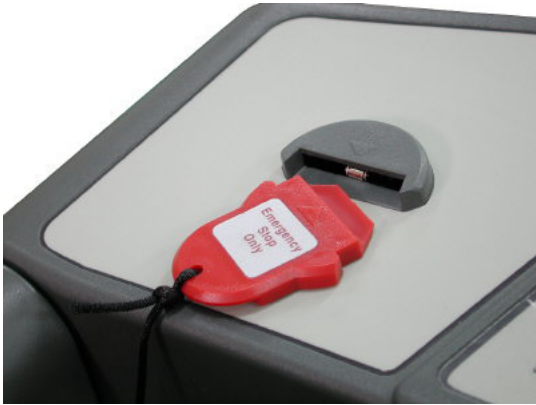
안전사고 예방용 안전키 (자석착탈식)