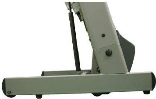
접이시 제품 밑면 (4개의 이동바퀴)