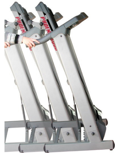
접이시 한손으로도 손쉽게 이동가능