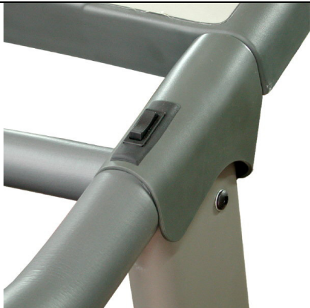
자동경사 조절용 버튼