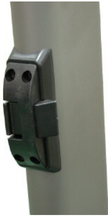
접이 잠금 장치 (왼쪽 핸들프레임에 위치)