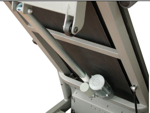
자동경사 조절용 모터