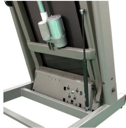
접이시 발판을 지탱해주는 유압실린더